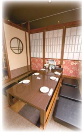
くつろげる空間づくりも人気

阿弥陀町魚橋の明姫幹線沿いにある「ごちそう村 高砂店」。大正5年に高砂町横町で創業した料亭をルーツとし、現在は兵庫県と大阪府に19店舗を展開する株式会社入船レストラン事業部の13店舗目の店である。 会社の歴史や規模もさることながら、驚かされるのがそのメニューの豊富さとコスパ（コストパフォーマンス）の高さ。「和食ダイニング」を名乗るだけあって、刺身、天ぷら、焼き鳥がメニューの柱となるが、加古川市にある同社の商品企画部が頭を絞った年に4回の季節メニュー