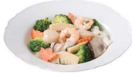
海老いか貝柱の広東風炒め

海鮮を生姜や白ネギの香味野菜と炒めることで、あっさりしながらも、香りとうまみのある一品に仕上げました。