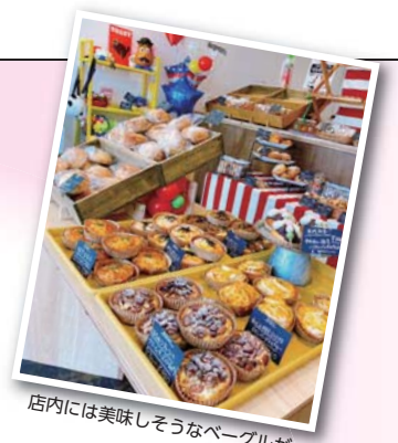
店内には美味しそうなベーグルが