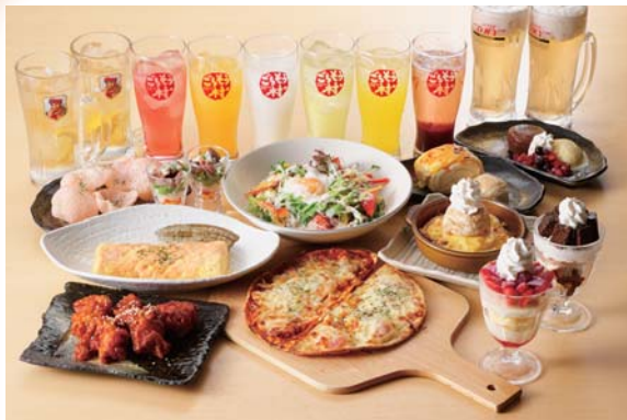
メニューの豊富さが「一番の売り」

阿弥陀町魚橋の明姫幹線沿いにある「ごちそう村 高砂店」。大正5年に高砂町横町で創業した料亭をルーツとし、現在は兵庫県と大阪府に19店舗を展開する株式会社入船レストラン事業部の13店舗目の店である。 会社の歴史や規模もさることながら、驚かされるのがそのメニューの豊富さとコスパ（コストパフォーマンス）の高さ。「和食ダイニング」を名乗るだけあって、刺身、天ぷら、焼き鳥がメニューの柱となるが、加古川市にある同社の商品企画部が頭を絞った年に4回の季節メニュー