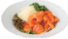
海老のチリソース