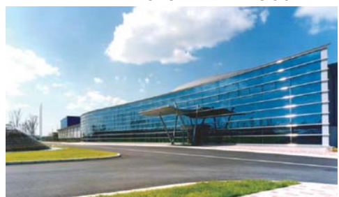
環境との調和を図っている高砂工場

【メモ】サントリープロダクツ(株)高砂工場 〒676-0008 高砂市荒井町新浜 2-2-1 ☎079-444-2900