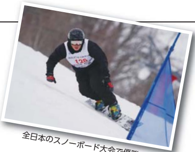
全日本のスノーボード大会で優勝も