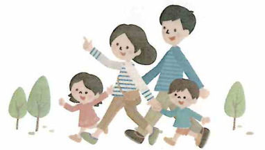
※記事は前回のものです。

お祭りやイベント、住民なら知っておきたい文化・歴史などを美しい写真と共に紹介。お住いの地域の、魅力再発見の為に企画特集ページです。注目度の高いページで、より高い広告効果が期待できます。